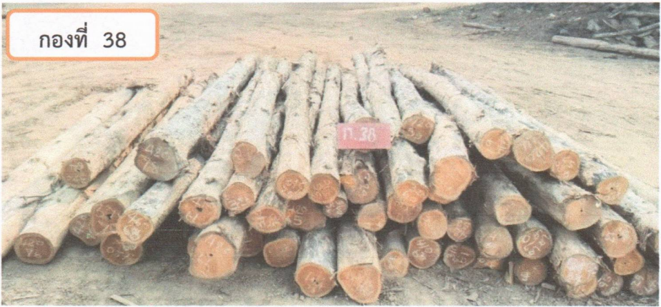
กองที่ 38 ความยาว 300-470 ม. ความโต 50-79 ซม. จำนวน 60 ท่อน ปริมาตร 6.53 ลบ.ม. ราคากรรมกรกำหนด 43,000.00 บาท