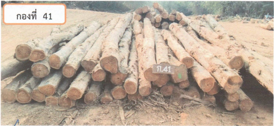
กองที่ 41 ความยาว 300-470 ม. ความโต 60-79 ซม. จำนวน 55 ท่อน ปริมาตร 6.53 ลบ.ม. ราคากรรมกรกำหนด 48,400.00 บาท

[Handwritten signatures and scribbles in blue ink are present below the caption for pile 41.]