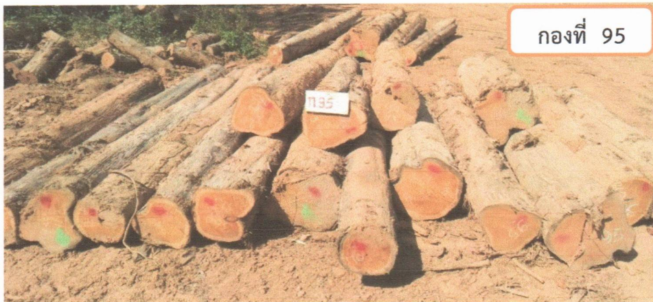
กองที่ 95 ความยาว 170-420 ม. ความโต 100-149 ซม. จำนวน 22 ท่อน ปริมาตร 6.35 ลบ.ม. ราคากรรมกรกำหนด 97,600.00 บาท