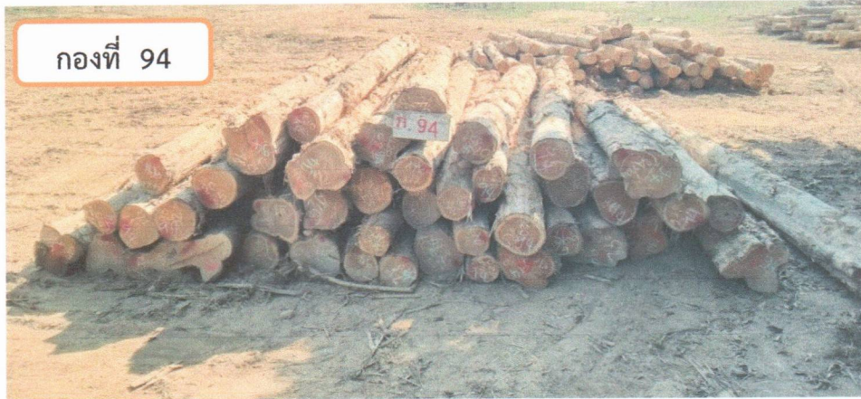
กองที่ 94 ความยาว 260-420 ม. ความโต 60-79 ซม. จำนวน 46 ท่อน ปริมาตร 6.79 ลบ.ม. ราคากรรมกรกำหนด 56,900.00 บาท