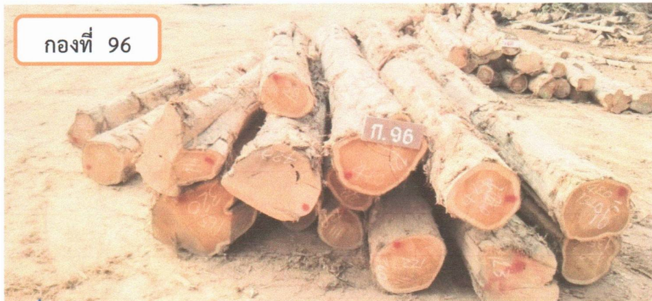
กองที่ 96 ความยาว 200-420 ม. ความโต 100-159 ซม. จำนวน 19 ท่อน ปริมาตร 6.33 ลบ.ม. ราคากรรมกรกำหนด 104,500.00 บาท

Handwritten signatures in blue ink are present at the bottom of the page, including a large signature on the left and another on the right.