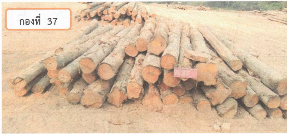
กองที่ 37 ความยาว 300-460 ม. ความโต 50-79 ซม. จำนวน 48 ท่อน ปริมาตร 6.54 ลบ.ม. ราคากรรมกรกำหนด 51,600.00 บาท